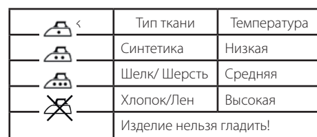
ТАБЛИЦА ТЕМПЕРАТУРНЫХ РЕЖИМОВ ДЛЯ ГЛАЖЕНИЯ РАЗЛИЧНЫХ ВИДОВ ТКАНИ

Первый нагрев: примерно 2-3 минуты, непрерывная работа — около минуты.